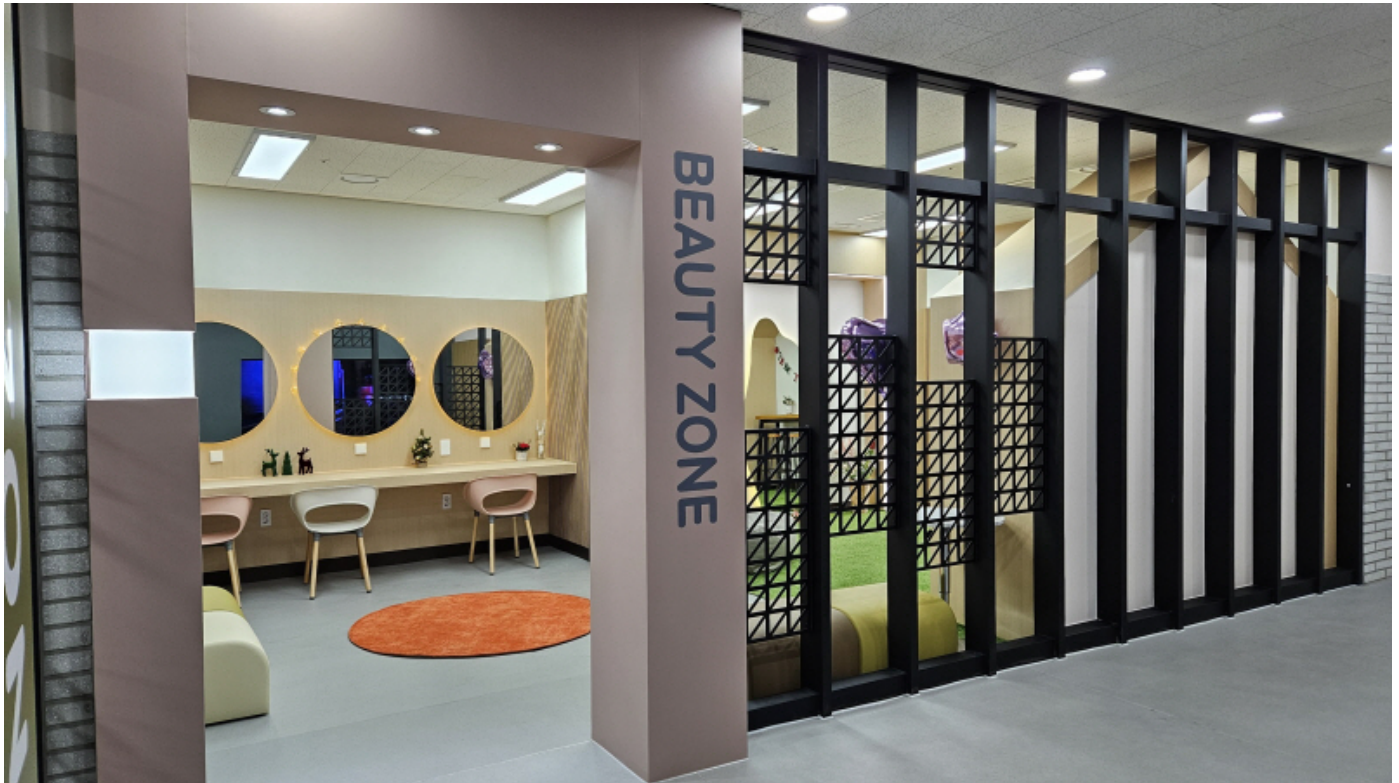
광주중앙도서관에 조성된 '청소년 해방구 야호 ZONE'

광주시교육청은 광주중앙도서관에 '청소년 해방구 야호 ZONE' 공간을 설치했다고 12일 밝혔다.