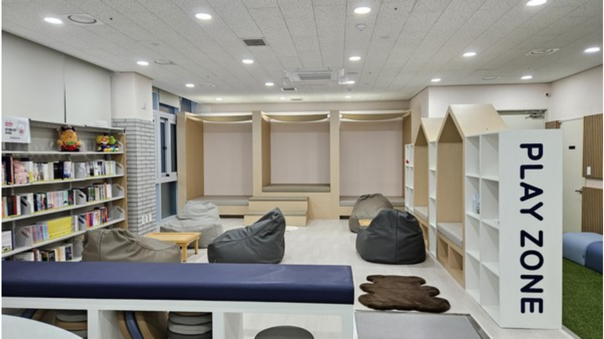
광주시교육청이 광주중앙도서관 내에 조성한 '청소년 해방구 야호 ZONE' 공간.

[광주타임즈] 전효정 기자=광주시교육청이 광주중앙도서관 내 '청소년 해방구 야호 ZONE' 공간 설치 공사를 마친 후 운영을 앞두고 있다고 11일 밝혔다.